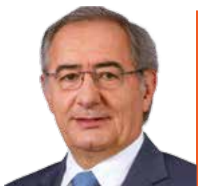
José Cesário Ex-Secretário de Estado das Comunidades Portuguesas