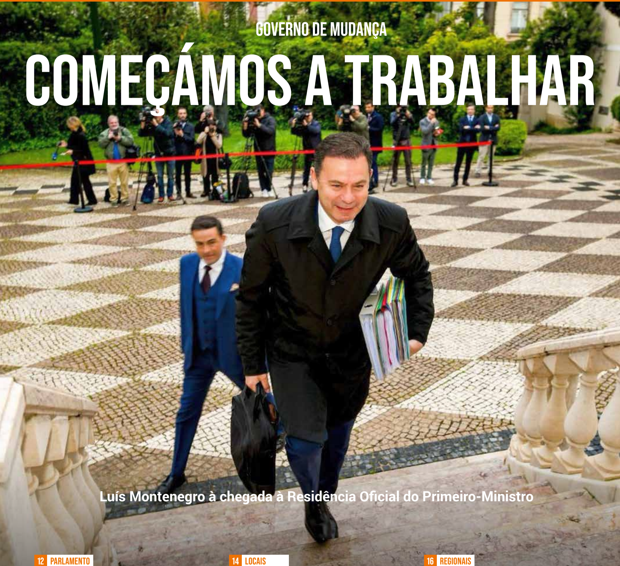
Luís Montenegro à chegada à Residência Oficial do Primeiro-Ministro