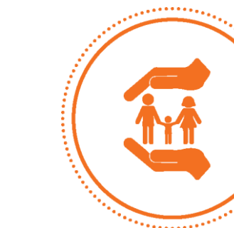
POLÍTICAS SOCIAIS E TRABALHO