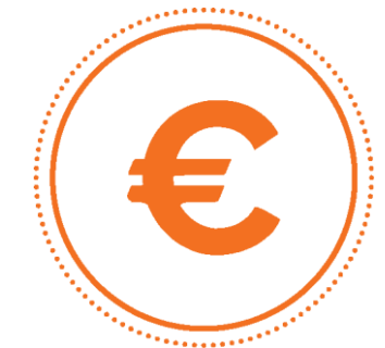
FINANÇAS PÚBLICAS E SEGURANÇA SOCIAL