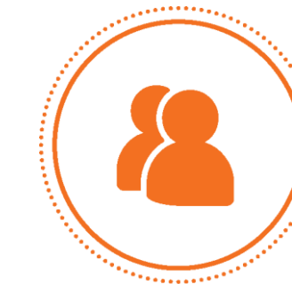
EDUCAÇÃO E FORMAÇÃO