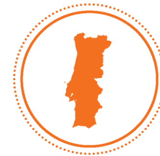
CIDADES, COMUNIDADES E COESÃO TERRITORIAL