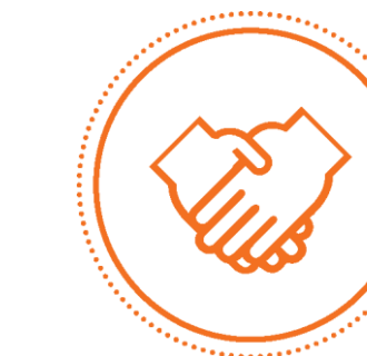
POLÍTICA EXTERNA, DIÁSPORA E ASSUNTOS EUROPEUS