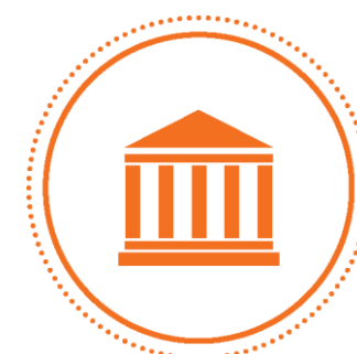
SERVIÇOS PÚBLICOS E REFORMA DO ESTADO