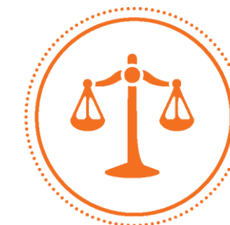
JUSTIÇA E REGULAÇÃO