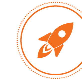
EMPREENDEDORISMO, INOVAÇÃO E DIGITALIZAÇÃO