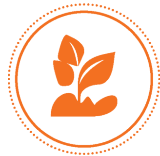
AGRICULTURA E ALIMENTAÇÃO