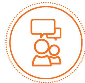
DIVERSIDADE, INCLUSÃO E IGUALDADE DE GÉNERO