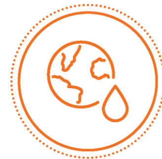
AMBIENTE E SUSTENTABILIDADE