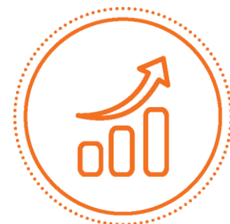
INVESTIMENTO E FUNDOS ESTRUTURAIS