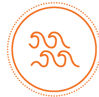
ASSUNTOS DO MAR