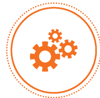
ECONOMIA E EMPRESAS