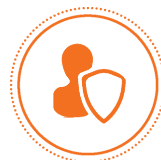
SEGURANÇA E PROTEÇÃO CIVIL