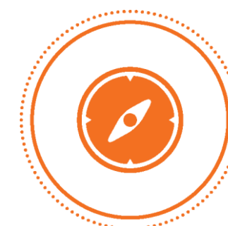
TRANSPORTES E INFRAESTRUTURAS