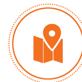
TURISMO E SERVIÇOS