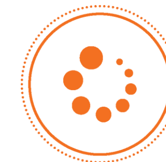
LONGEVIDADE E BEM- ESTAR