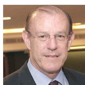
Prof. Doutor Carmona Rodrigues